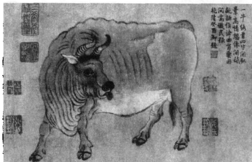
五牛图·局部·唐代·韩滉——现存北京故宫博物院

韩滉(723~787年)，字太冲，长安(今陕西西安)人。经历玄宗至德宗四代。他是唐代宰相韩休的儿子，在唐德宗时期历任宰相、两浙节度使等职，封晋国公，是一位拥护统一、反对分裂割据的地主阶级政治家。擅画人物和畜兽，以绘田家风俗和牛羊著称。《五牛图》中所绘的五头神态各异的牛，或行、或立、或俯首、或昂头，动态十足。可贵的是，画面上没有背景衬托，完全以牛为表现对象，如果不是对牛进行了细致地观察，对牛的造型描绘有十足把握的话，是万不敢涉此绘画风险的。画家勾勒牛的线条虽然简洁，但是画出的筋骨转折十分到位，牛口鼻处的绒毛更是细致入微，目光炯炯的眼神体现了牛的温顺而又倔强的性格。在鼓励农耕的时代，以牛入画有着非常的含义。