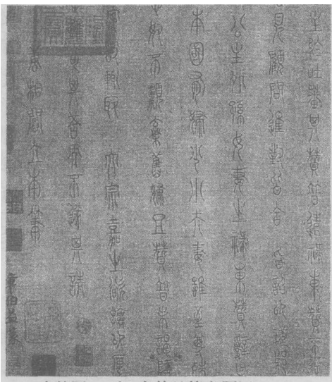
步辇图 宋 章伯益篆书题记

既然此画是宋人摹本，那么章篆末行何以称其为“唐相阎立本笔”，张向题跋又称其为“阎相国之本”呢？这其实是当时文士对官